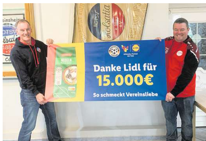
Über einen dicken Zuschuss aus der Lidl-Aktion „Nudeln für Vereine“ kann sich der NDTSV Holsatia in Kiel freuen.

Das Fußballteam des NDTSV Holsatia Kiel kann sich über eine Finanzspritze in Höhe von 15.000 Euro aus der Lidl-Aktion „Nudeln für Vereine“ freuen. Der Verein hat im Mai den „Nudeln für Vereine“-Post des Lebensmitteleinzelhändlers kommentiert und sich als einer von zehn Fußballklubs für die anteilige Ausschüttung des Verkaufserlöses einer Sonderedition Nudeln qualifiziert. Pro Aktionspackung Pasta gingen 50 Cent zu gleichen Teilen an jeweils fünf von insgesamt rund 450 Vereinen, die auf Facebook und Instagram kommentiert und am meisten Likes erhalten haben. Die Summe rundet Lidl auf insgesamt 150.000 Euro auf und zahlt jedem der zehn Gewinnervereine 15.000 Euro.