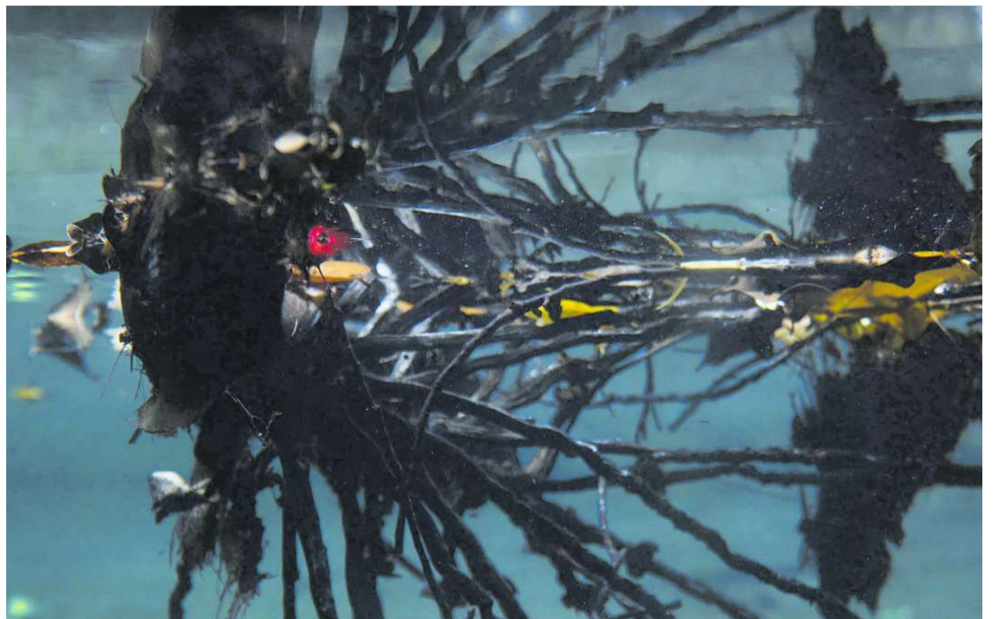
Monica Ursina Jäger, „Rete Mirabile (counter-current)“, 2020. Standbild aus dem 6:55 Minuten langen Video.