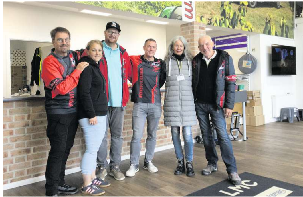
Das Team von „Winter's Caravan-Center“ blickt erneut auf ein gutes Verkaufsjahr zurück.