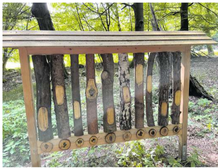
An dieser Erlebnisstation beißen sich fast alle die Zähne aus. Es gilt, den Rinden die richtigen Bäume zuzuordnen.

Die Wald-Erlebnisstationen, die Teil des Naturpark-Wanderwegs sind, sind ab dem Parkplatz Hopfenkrug an der Ecke Liethberg/Hopfenkrug am Emkendorfer Kreuz ausgemaltes. Martin Geist