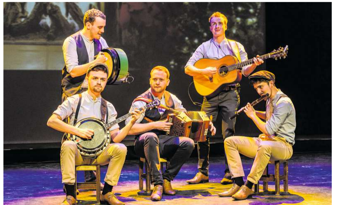
Preisgekrönte irische Musiker wollen ihrem Publikum Gänsehautmomente beschern.

Tickets gibt es für 42,40 Euro, gegebenenfalls plus Versand, über www.eventim.de oder bei www.reservix.de für 39,90 Euro plus Gebühren und gegebenenfalls Versand