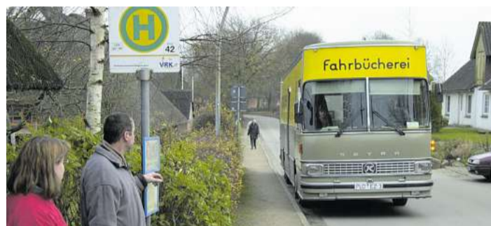
Grünlich grau, dafür mit gelber Banderole waren die ersten Bücherbusse in den 1970er-Jahren im Kreis Plön unterwegs. Einer dieser Busse wurde später von einer Privatperson gekauft und äußerlich unverändert innen zum Wohnmobil umgebaut.

Hause oder unterwegs digitale Medien entleihen. Träger des Angebots ist der Büchereiverein, der sich die Kosten mit dem Kreis und den teilnehmenden Gemeinden teilt. Die Büchereizentrale Schleswig-Holstein unterstützt die Fahrbibliotheken darüber hinaus mit Vertretungspersonal, in der Fahrzeugtechnik sowie in der Haushaltsverwaltung. www.fahrbuechereikreisploen.de