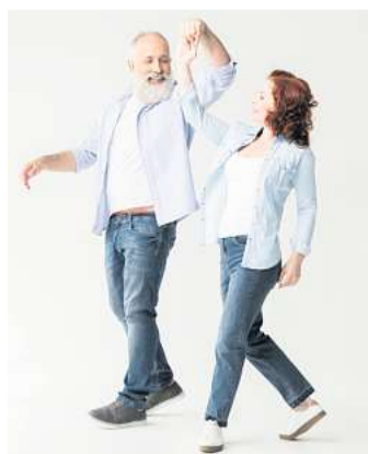
Tanzen macht in jedem Alter Spaß!

Bereits ab 27. Oktober gibt es in der Tanzschule Tessmann mehrere Termine zur Auswahl für eine kostenlose und unverbindliche Schnupperstunde für Erwachsene. Die neuen Grundkurse (Gesellschaftstänze Standard und Latein) starten dann gleich nach den Herbstferien. Es gibt vier Wochentage mit unterschiedlichen Uhrzeiten zur Auswahl, sodass der Tanzkurs zeitlich flexibel zusammengestellt werden kann.