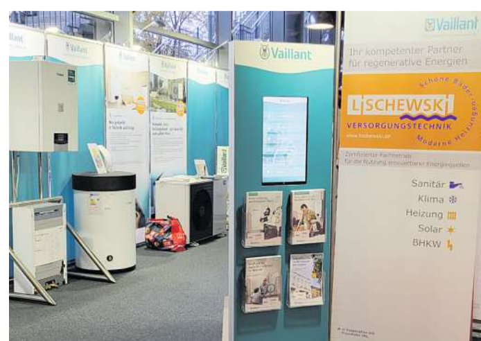
Lischewski Versorgungstechnik präsentiert sich an Messestand 112.

Lischewski Versorgungstechnik GmbH Ellerbeker Weg 64-66, Kiel www.lischewski.de