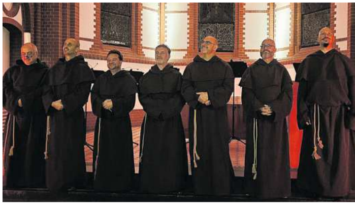
In klassische Mönchskutten gekleidet singen die „Magic Gregorian Voices“ in der Kieler St.-Nikolai-Kirche.