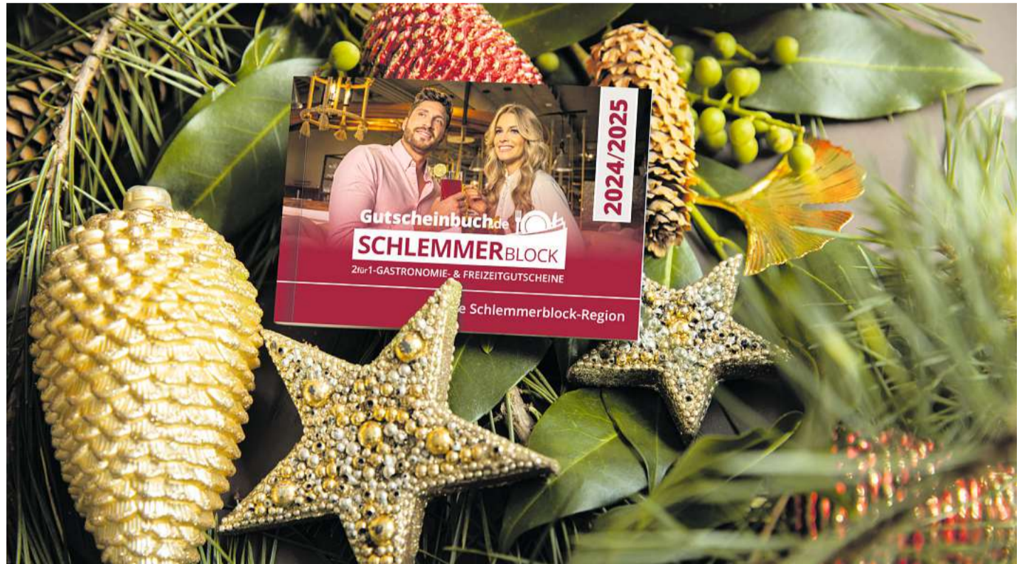
Als kleiner Block voller Möglichkeiten könnte der „Gutscheinbuch.de Schlemmerblocks 2025“ auch ein gutes Weihnachtsgeschenk sein.