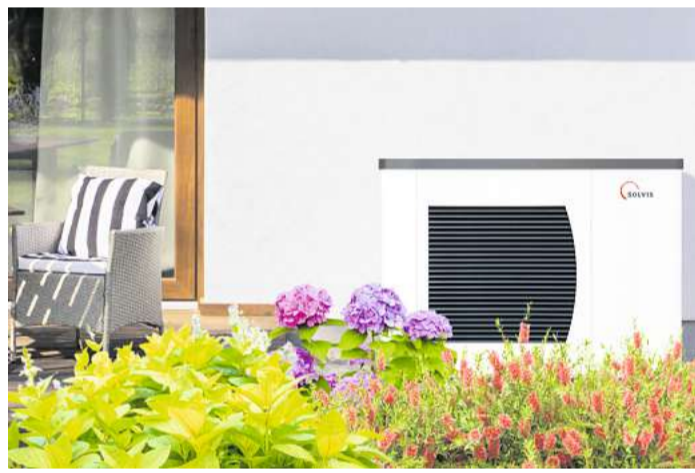
Die Wärmepumpe SolvisPia ist modular ausbaufähig.

Sanitär- und Heizungstechnik Uwe Richter Teichstraße 5 Schwentental www.rsh-kiel.de