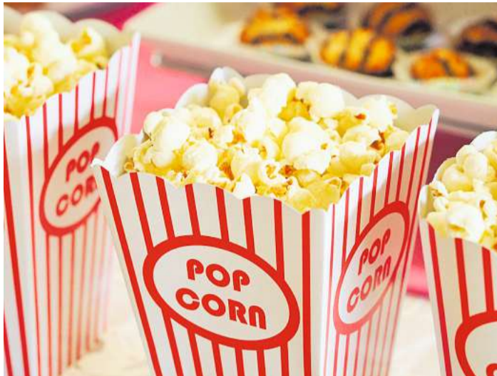
Popcorn darf auf dem Büfett einer Film-Party nicht fehlen. Der Staubsauger danach auch nicht.

bestimmt auch die ein oder andere Überraschung bereit. Aus Fahrrad- und Autofelgen werden Lenkeinheiten; Bügelleisen, alte CDs oder DVDs eignen sich hervorragend zum Glitzereinsatz. Hier und da eine Konfetti-Kanone stationiert, macht das i-Tüpfelchen der Weltraumeroberung aus. Und natürlich müssen die Gäste kostümiert kommen. Zu essen gibt es alles, was so als Tütennahrung zu bekommen ist – oder auch nicht. vmm