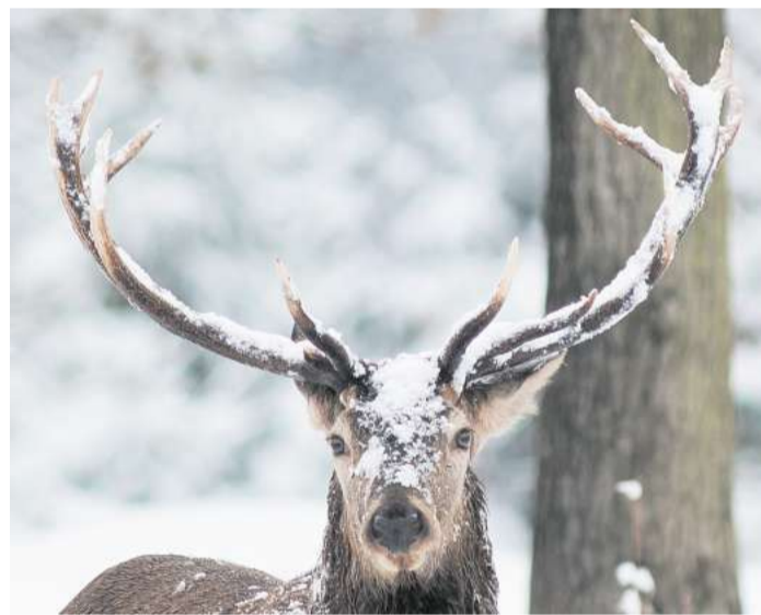
Um Energie zu sparen, lassen sich Rothirsche im nahrungsarmen Winter in eine Art Winterruhe fallen.

Tiere dann mühsam wieder hineinfuttern. „Hirsche gewöhnen sich an die regelmäßigen Bewegungen von Menschen. Problematisch wird es, wenn Mensch oder Hund sich auf einmal fernab der Wege hervorwagen“, sagt Meißner. „Man sollte beim Winterspaziergang nicht querfeld-ein laufen. Hunde sollten immer angeleint sein.