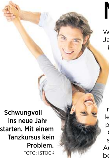
Schwungvoll ins neue Jahr starten. Mit einem Tanzkursus kein Problem.

Schleswig-Holsteins größter Hallen-Flohmarkt Jetzt buchen! 5. Jan. Holstenhallen Neumünster Reservierung empfohlen! Das Anmeldeformular erhalten Sie über unser Büro oder auf www.Nord-Flohmarkt.de Gröneberg-Veranstaltungen Info: 04121 - 475 28 08 Nord-Flohmarkt.de