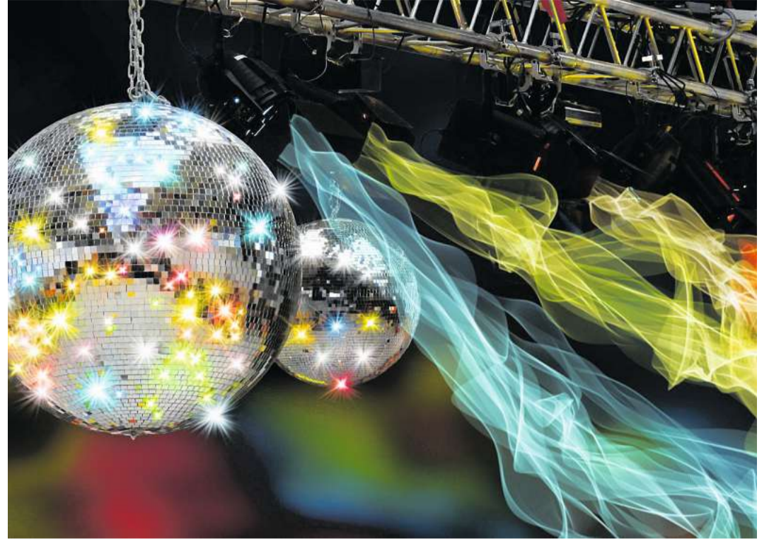
Eine Disco-Kugel ist ein absolutes Muss auf einer 80er-Jahre-Party.

Ach, kommen Sie! Die 80er waren doch ein echter Hit, und irgendwas mit Schulterpolstern, Neon oder Tüll findet sich bestimmt im Schrank. Einer aus dem Freundeskreis hat