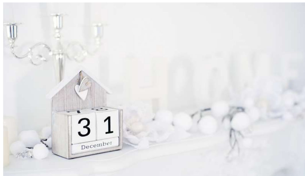
Ein Tag – viele Namen: der 31. Dezember.

Das hat natürlich etwas mit der christlichen Kirche zu tun. Und die hat nicht überall einen so großen Einfluss wie bei uns. Der Name des letzten Tages des Jahres geht demnach auf den heiligen Silvester zurück, der von 314 bis zu seinem Tod am 31. Dezember 344 Bischof von Rom war. Hätte es damals schon einen Papst gegeben, wäre er Papst gewesen. Den gab es aber noch nicht. Trotzdem ist der 31. Dezember für Katholiken der Namenstag des heiligen Silvester. Mit i übrigens und nicht mit y. So schreibt sich der Kater aus der Comic-Serie „Tom & Jerry“. In deutschsprachigen Ländern hat sich der Namenstagname für den letzten Tag im Jahr durchgesetzt, viele andere Länder belassen es bei der Bezeichnung als letzten Tag vor dem neuen Jahr.