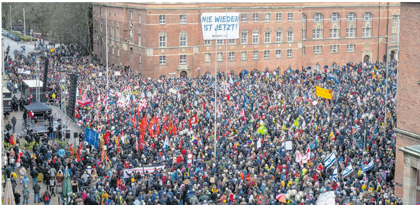
Bereits im vergangenen Jahr trafen sich am 27. Januar mehr als 11.000 Menschen zur Demo gegen Rechtsextremismus auf dem Rathausplatz. Alle, die am Montag Teil der Menschenkette werden wollen, treffen sich unter dem Banner, das an der Opernhausfassade hängt.