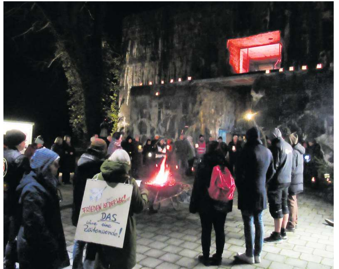
Zum Holocaust-Gedenken und als Friedens-Mahnung tauchen die Besucherinnen und Besucher den Flandernbunker am Montag in den Schein ihrer mitgebrachten Lichter.