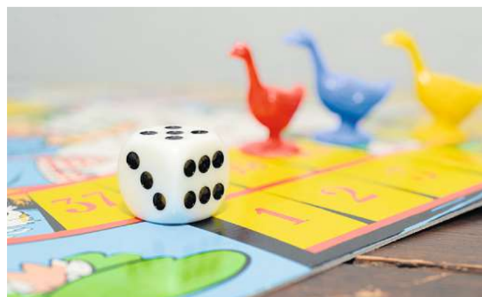
In der anna Elmschenhagen-Nord können unter anderem Brettspiele ausgeliehen oder vor Ort ausprobiert werden.

die Frauengruppe des SoVD trifft sich alle zwei Monate am ersten Mittwoch von 14.30 bis 17 Uhr. Für den zweiten und vierten Mittwoch sowie den dritten Freitag im Monat lädt die anna von 14.30 bis 17 Uhr beziehungsweise 15 bis 17 Uhr zum Rummikub spielen ein. Der Aquarell-Malkursus immer am zweiten und vierten Donnerstag im Monat von 9 bis 11.30 Uhr ist offen für alle. Die Migrationsberatung der Stadt Kiel findet an jedem ersten und dritten Donnerstag im Monat von 10 bis 12 Uhr statt. Die Sportgruppen 1, 2 und 3 treffen sich jeweils freitags von 8 bis 9 Uhr, von 9 bis 10 und von 10 bis 11 Uhr. Anmeldungen unter Tel. 0431/789510 oder 0431/788787. Spiele, Bücher und Puzzle können sich Besucherinnen und Besucher außerhalb der Ferien an jedem ersten und dritten Freitag im Monat zwischen 14 und 15 Uhr ausleihen. Wer Spiele nicht ausleihen, sondern vor Ort ausprobieren möchte, trifft sich an jedem ersten Freitag im Monat ab 18 Uhr zur offenen Spielgruppe.