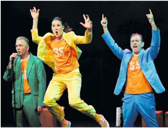
Mit „Schwitzende Männer 2“ ist das Theater Deichart im Februar im Waldhof zu erleben.

Kultur vor Ort Kroog präsentiert das Frühjahrsprogramm