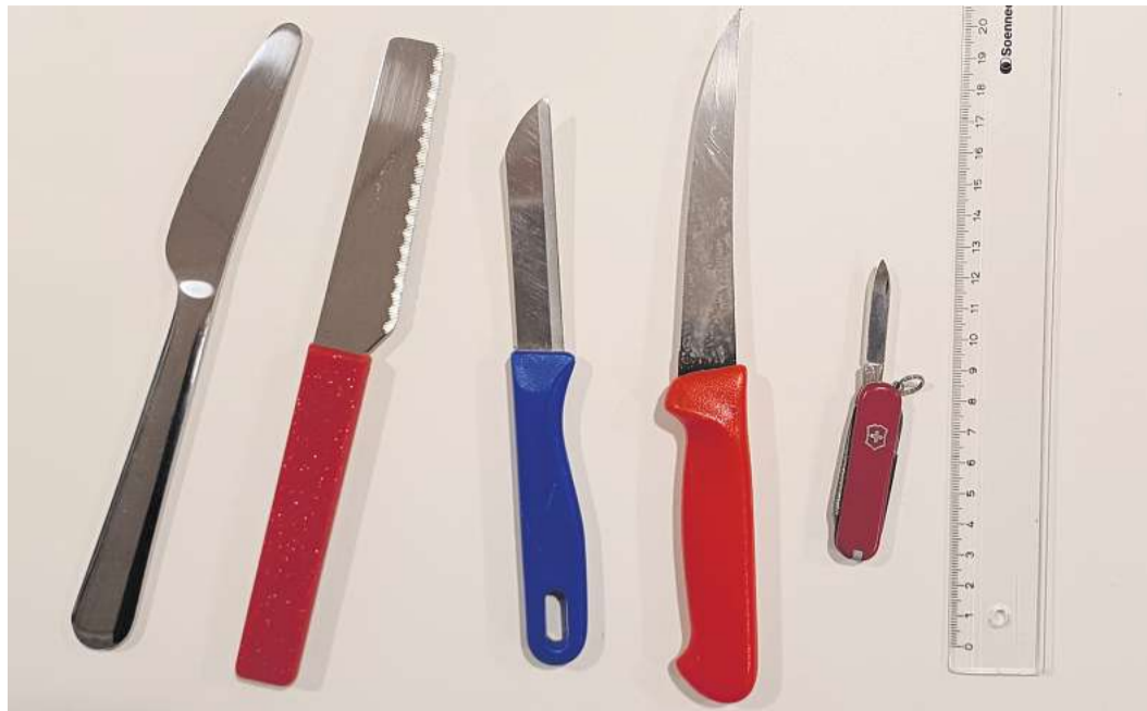
Das Waffen- und Messerverbot im schleswig-holsteinischen Nahverkehr umfasst alle Messer, egal wie sie beschaffen sind. Auch Haushaltsmesser und Mini-Taschenmesser fallen darunter.

Wer aber einen Ausflug machen will und dabei gerne sein Schweizer Taschenmesser dabei haben möchte, um damit einen Stock zu schnitzen, Äpfel zu schälen oder ein Brot zu schmieren, kann es unter bestimmten Bedingungen trotzdem einpacken. Und zwar am besten ganz unten in den Rucksack oder ordentlich eingewickelt in eine verschließbare Innentasche in einer ver-