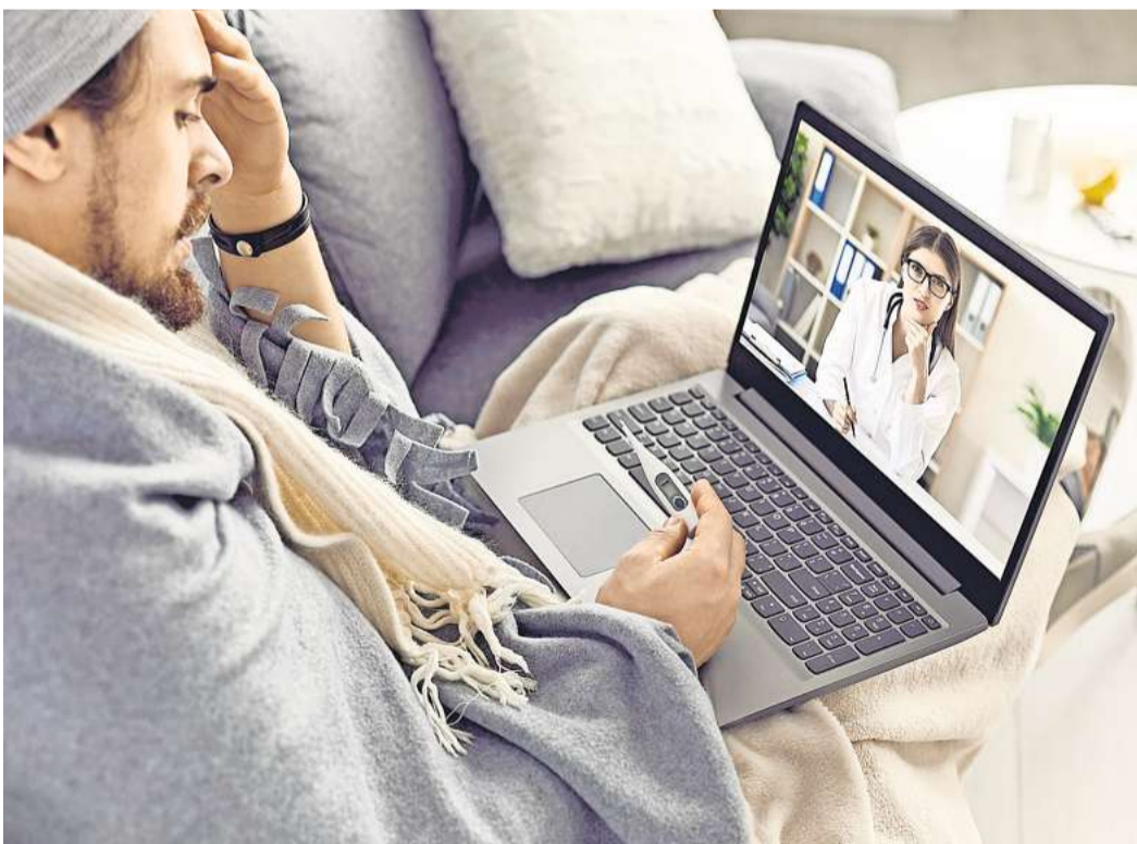
Durch Videosprechstunden ist der persönliche Besuch in der Arztpraxis nicht mehr zwingend erforderlich. Dadurch sparen Patienten Wartezeit und Wege.

„Videosprechstunden sind eine sinnvolle Ergänzung zum persönlichen Kontakt zwischen Patientinnen und Patienten und einem Arzt oder einer Ärztin. Und nicht nur auf dem Land, wo die Wege zur Praxis weiter sein können, machen digitale Lösungen Sinn“, sagt Tom Ackermann, Vorstandsvorsitzender der AOK NordWest.