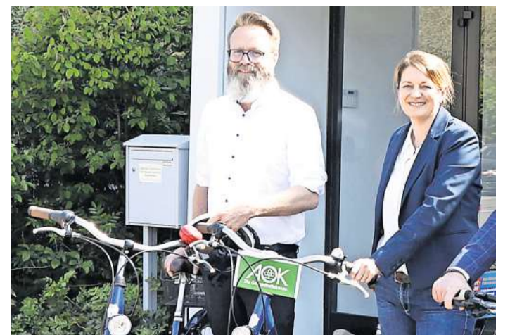
Blicken auf eine erfolgreiche Aktion „Mit dem Rad zur Arbeit“ in 2024: AOK-Landesdirektorin Iris Kröner und Verkehrsminister Claus-Ruhe Madsen.

Landes-Verkehrsminister Claus Ruhe Madsen als Schirmherr der Aktion betonte: „Der Radverkehr im nördlichsten Bundesland ist auf einem guten Weg: Die Verbesserungen und der Ausbau der Radinfrastruktur werden kontinuierlich weitergeführt. Schleswig-Holstein stärkt damit seine Position als fahrradfreundliches Bundesland.“