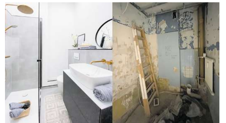
Eine notwendige Sanierung einer Wohnung stellt viele Eigentümer oft vor finanzielle, zeitliche und nervenaufreibende Probleme. Für die beiden Kieler beginnt hier ihre Passion.

Nordlicht Projekt GmbH Holtener Str. 322, Kiel Tel. 0176/80127055 ahoi@nordlicht-projekt.de www.nordlicht-projekt.de