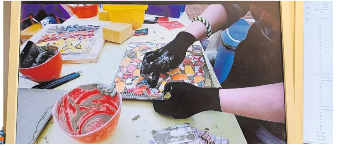
Der Kurzfilm „In Gaarden ist Kunst“ stellt verschiedene Kunstprojekte der vergangenen Jahre vor und zeigt ihre Bedeutung für das Zusammenleben im Stadtteil.

Die Künstler und Künstlerinnen sollen die Perspektive des Stadtteils Gaarden einnehmen und zusammen mit Menschen von dort im Stadtteil etwas erschaffen. Eine Zusammenarbeit mit überregionalen und internationalen Kunstschaffenden ist wünschenswert. Eine Bewerbung ist ausschließlich digital möglich. Infos dazu sind unter www.kiel.de/kunstgaarden zu finden. Über diese Webseite ist auch der rund 25-minütige Kurzfilm „In Gaarden ist Kunst“ des Filmemachers Florian von Westerholt zu finden. Im Auftrag der Stadt hat er in den vergangenen Jahren verschiedene „interventionistische Kunstprojekte“ besucht, um mit diesem Film zu zeigen,