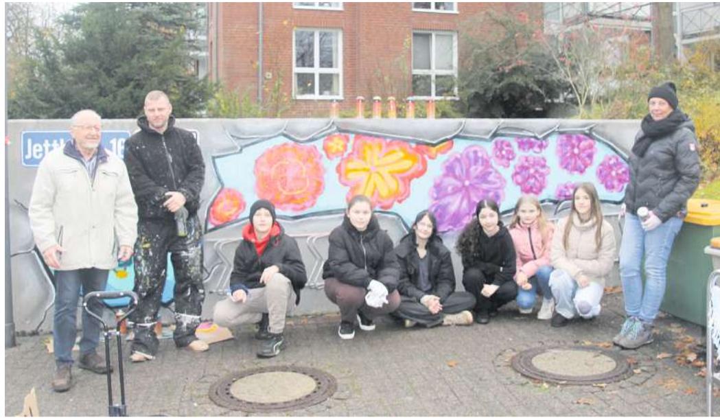
Die Freude über die gelungene Verschönerungsaktion der grauen Betonwände am Lisa-Hansen-Haus ist bei allen Beteiligten groß.