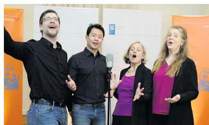
Mit mehrstimmigem A-cappella-Gesang begeisterte ein Quartett des NDR-Vokalensembles die Gäste der Vorstellungveranstaltung.

binde die Stimme Menschen unterschiedlichster Herkunft miteinander. „Kurzum: Die Stimme ist eine Basis für Kommunikation und Völkerverständigung in der Musik und darüber hinaus“, so die Parlamentspräsidentin. Zum „Jahr der Stimme“ sind zahlreiche Konzerte, Workshops und Gesangsaktionen geplant. Auch das NDR-Vokalensemble wird dabei mehrfach zu erleben sein. Eine stets aktualisierte Übersicht über die Veranstaltungen und Angebote ist unter www.instrument-des-jahres.de zu finden.