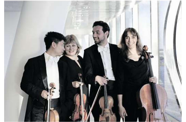
Klassik wird im Mai mit dem Noah-Quartett in der Stephanuskirche geboten.

Karten gibt's im Vorverkauf für 19, erm. 17 Euro, an der Abendkasse für 21, erm. 19 Euro. Am Sonnabend, 10. Mai , ist das Noah-Quartett mit einem Klassikkonzert und Werken von Beethoven, Mendelssohn Bartholdy und Schubert in der Stephanuskirche , Allgäuer Straße 1, zu Gast. Die Mit-