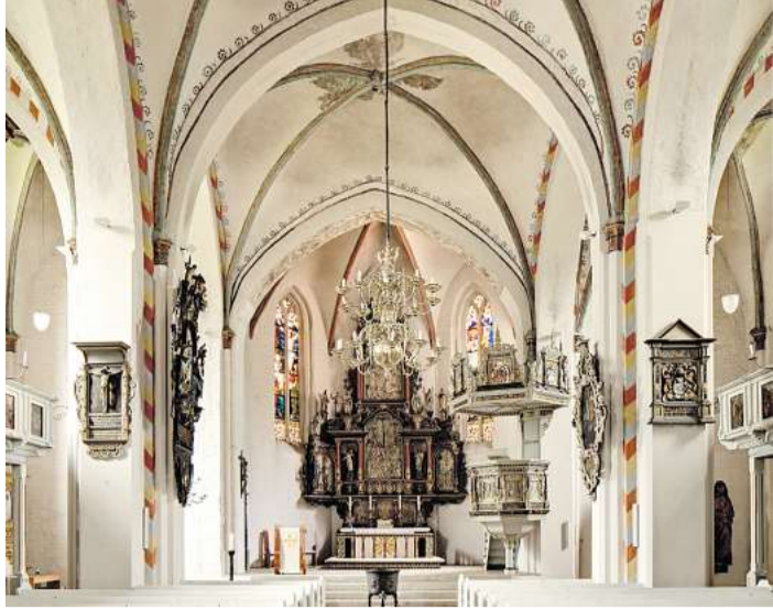
Für eine Chornacht mit vielen Teilnehmenden bietet die St.-Marien-Kirche in Rendsburg einen besonders schönen Rahmen.