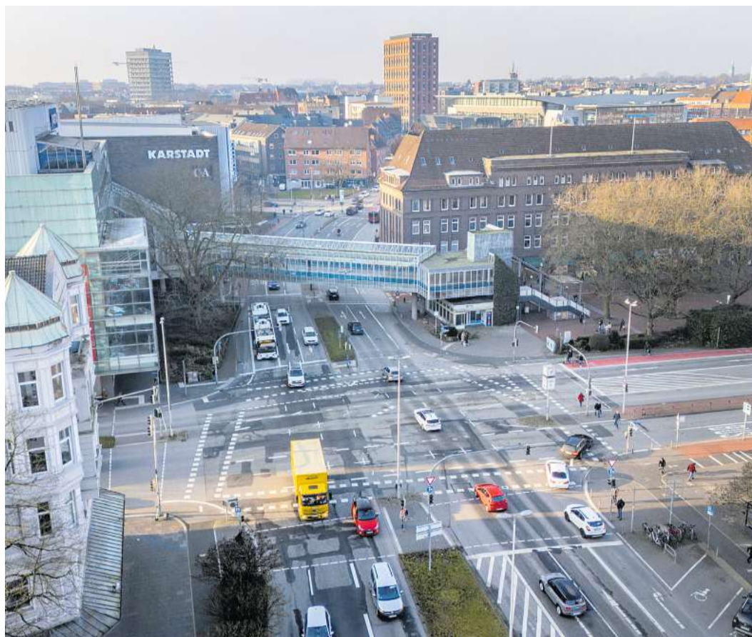
Der Stresemannplatz im Zentrum von Kiel. Für die Sanierung der strapazierten Asphaltdecke und der Neugestaltung für den Fuß- und Radverkehr, wird der Bereich zu Beginn der Sommerferien voraussichtlich etwa zwei Monate lang umgebaut.

In der Kieler Innenstadt wird der Stresemannplatz neugestaltet, um die Verkehrssicherheit für den Fußverkehr und Radfahrende zu verbessern, ohne den Autoverkehrsfluss zu behindern. Dazu müssen Fahrbahnen umgewidmet, taktile Elemente ergänzt und Ampeln versetzt sowie Ampelsteuer-