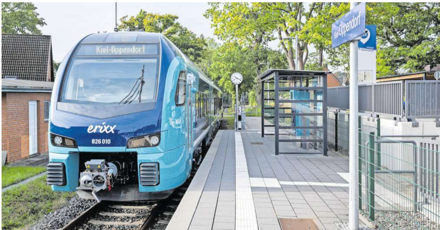
Von Kiel über Oppendorf nach Schönkirchen, Probsteierhagen und Schönberg: So soll die Strecke „Hein Schönberg“ ab Ende 2027 aussehen.