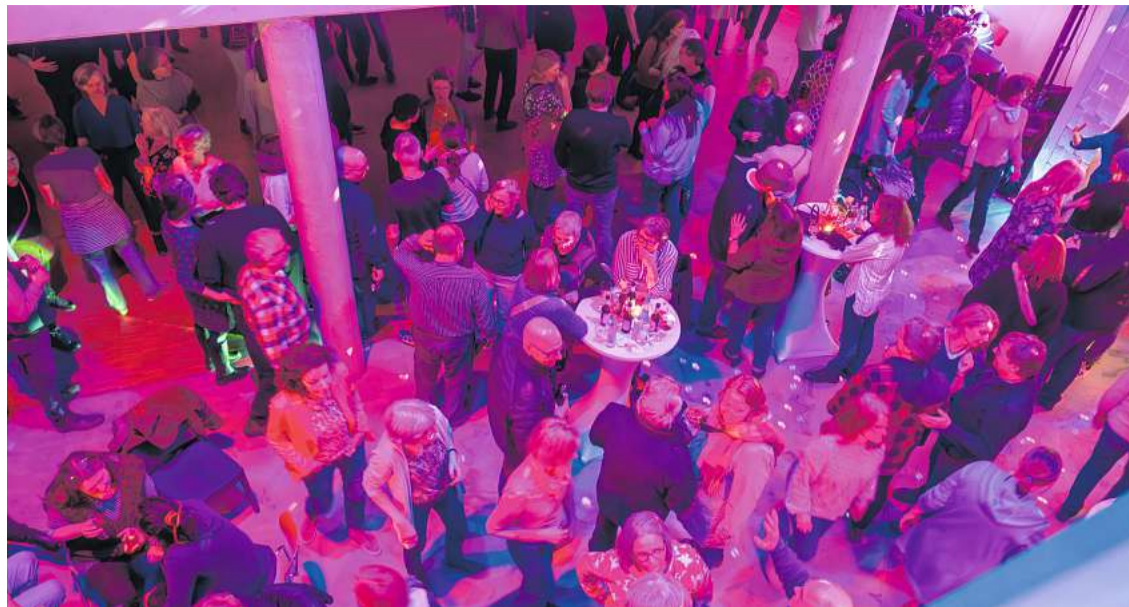
Im vergangenen Jahr ließen viele Menschen die Preetzer Kulturnacht im Haus der Diakonie ausklingen. In diesem Jahr spielt dort ab 22 Uhr die Band „Blue Highway“.