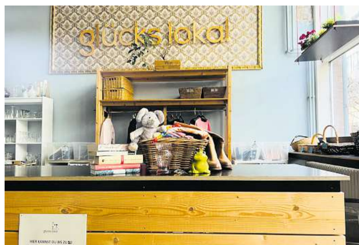
Im Glückslokal können aussortierte Teile abgegeben werden.

Nicht angenommen werden veraltete Technik, Werbepartikel oder Möbelstücke. Zudem sollen die Teile in einem Zustand sein, in dem man sie auch selbst mitnehmen würde. Weitere Infos: www.glueckslokal.de