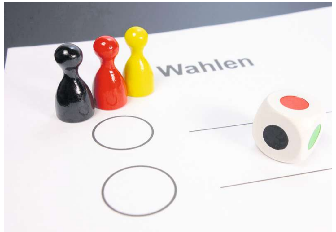
Wählen gehen, ist eine Möglichkeit, die Demokratie zu gestalten. Sich in die Gesellschaft einbringen kann man sich aber noch vielfältiger. Das soll die Veranstaltung aufzeigen.

Neben der einfachsten Möglichkeit, das Grundrecht auf Mitbestimmung auszuüben, indem man wählen geht, können Menschen aber auch ein Ehrenamt ausüben, andere Menschen unterstützen oder einen Freiwilligendienst übernehmen. Weitere Möglichkeiten sind zu demonstrieren, sich kulturell einzubringen oder eine eigene Idee oder Initiative umzusetzen. „Wir sind überzeugt, dass es für jeden und jede, unabhängig von Alter, Herkunft, sozialem oder finanziellem Hintergrund, Möglichkeiten gibt,