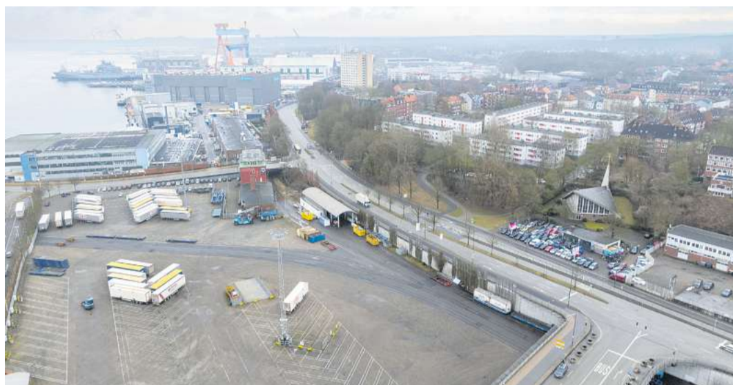
Voraussichtlich bis zur Kieler Woche läuft der Verkehr in der Werftstraße zwischen der Werft und der Straße Zur Fähre nur einspurig wechselseitig an der Baustelle vorbei.

Kfz-Verkehr zwischen Elisabethstraße/Werfteinfahrt und Zur Fähre auf jeweils einer sehr breiten Fahrspur je Richtung. Seit ein paar Tagen laufen bereits die Arbeiten nahe der Einmündung der Straße Zur Fähre. Der erste Abschnitt reicht bis kurz vor die Wohnhäuser, drei weitere Abschnitte bis Elisabethstraße/Werfteinfahrt folgen. Die Arbeiten sollen vor der Kieler Woche abgeschlossen sein. Nach der Kieler Woche wird bis in den Herbst hinein in den Nebenflächen gearbeitet. 2026 stehen weitere Arbeiten sowie Asphaltierungen bis zur Kaiserstraße an. Weitere Infos zu diesen Arbeiten sind auf www.kiel.de/werftstrasse zu finden.