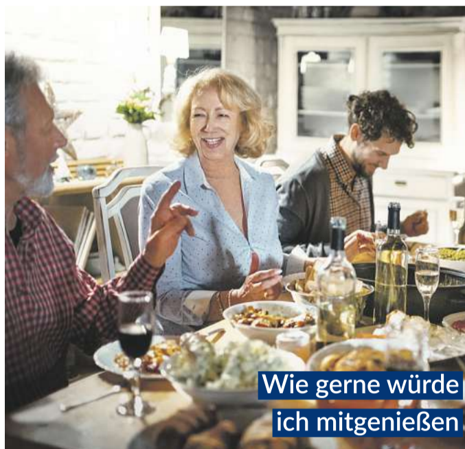
Wie gerne würde ich mitgenießen

nur in GASTEO Magen-Tropfen erhältlich, sorgen sechs clever kombinierte Heilpflanzen für eine schnelle „Erste Magen- und Verdauungshilfe“. Bitterstoffe – enthalten in Wermut-, Benediktenkraut und Angelikawurzel – erhöhen rasch die Speichelproduktion und regen im Magen-Darm-Trakt Gallensaft und Magensäure an. 1,2 Zusätzlich entspannen Gänsefingerkraut, Süßholzwurzel und Kamillenblüten und bringen ein wohlige Bauchgefühl.