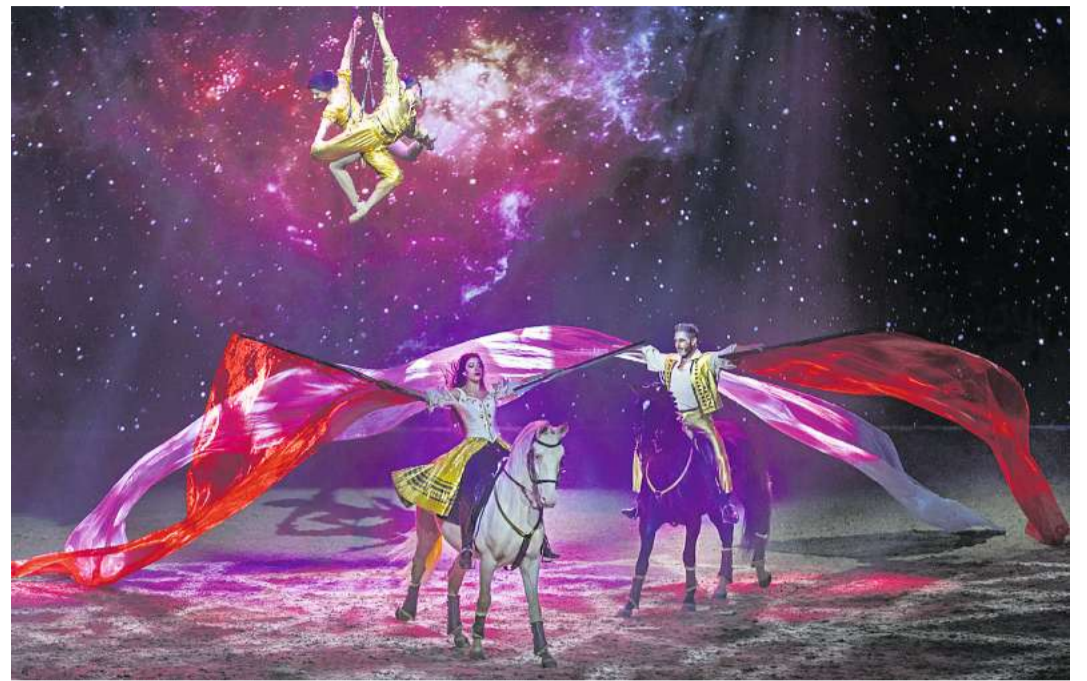
Bei Cavalluna trifft Reitkunst auf ganz viel Show und eine emotionale Geschichte.

Erzählt wird die Geschichte des in die Jahre gekommenen Clowns Trol, der nach seiner letzten Show allein zu Hause ist und Angst davor hat, ohne seine Freunde aus der Showwelt einsam zu sein. Da erscheint ihm Sol, die Quelle des Lebens, und erklärt ihm, dass es nur eine Chance gebe, sein Herz für immer zu füllen: sich noch einmal an all die besonderen Momente und Gefühle seines Lebens zu erinnern. So könne er den Schlüssel zu innerer Ruhe finden. Sol führt ihn auf eine Reise durch die Welt seiner Emotionen. Obwohl „Cavalluna – Grand Moments“ weit mehr ist