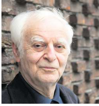
Adolf Muschg liest am Donnerstag, 13. März, aus seinem Buch „Nicht mein Leben“.