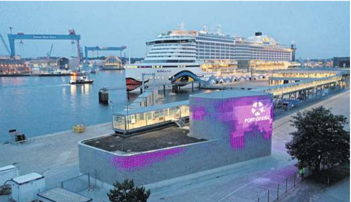
Mit seiner leuchtenden, variabel gestaltbaren Fassade macht das Landstrom-Technikgebäude am Kieler Ostsee-Kai die umweltfreundliche Energieversorgung von Kreuzfahrtschiffen sichtbar.

Weil nach Angaben der Förde Sparkasse in ihren Filialen immer seltener Finanzdienstleistungen nachgefragt werden, dafür aber der Bedarf an persönlicher Beratung steige, stellt die Förde Sparkasse seit einiger Zeit ihr Filialnetz teilweise um.