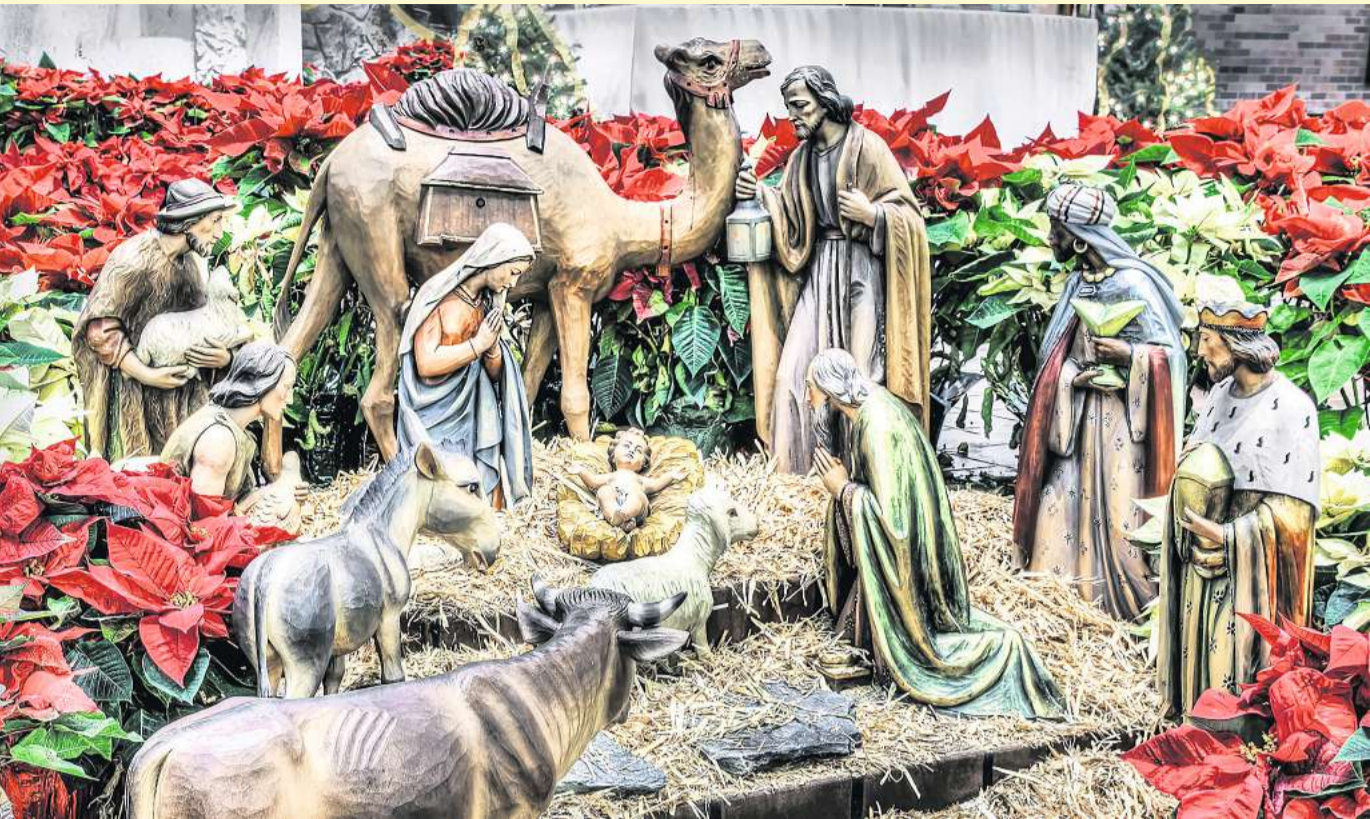
An Weihnachten feiern Menschen in aller Welt die Geburt von Jesus Christus.

Kompass-Kirchengemeinde Dankeskirche Holtenau Heiligabend, 24. Dezember 15:00 Krippenspiel und Kinderchor -