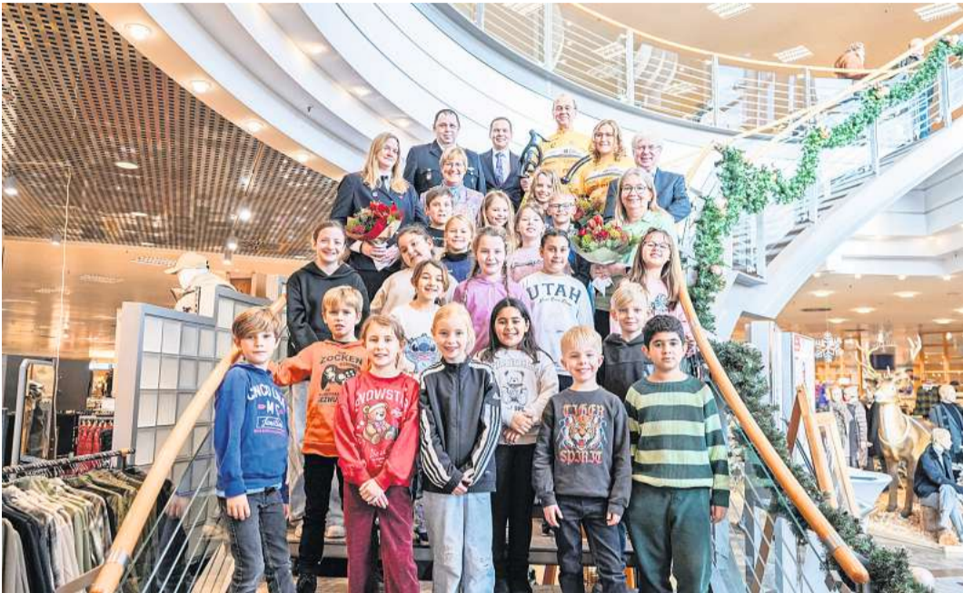
Nortex spendete 8888 Euro zum Nikolaustag unter anderem an die Grundschule Wittorf.