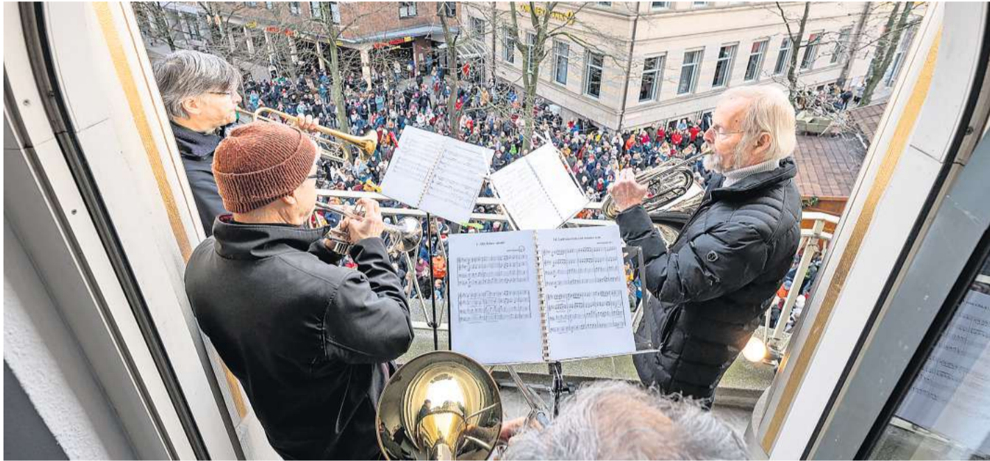
Am 24. und 31. Dezember erklingen wieder Weihnachtschoräle vom Balkon der Kieler Nachrichten.