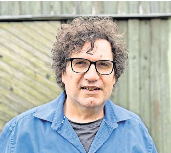
Der Lyriker und Professor der Muthesius-Kunsthochschule Oswald Egger wird mit dem Kieler Kulturpreis ausgezeichnet.

Der 1963 in Südtirol geborene und seit 2002 auf der Raketenstation Hombroich (Neuss) lebende Oswald Egger gilt aktuell als einer der bedeutendsten zeitgenössischen Lyriker im deutschsprachigen Raum. „Seine Werke sind geprägt von einer tiefgreifenden Auseinandersetzung mit Sprache, Klang, Bewegung und Textur“, heißt es in der Begründung des Ratsbeschlusses. Egger wurde vielfach ausgezeichnet – unter anderem erhielt er 2024 den renommierten Georg-Büchner-Preis – und seine Werke wur-