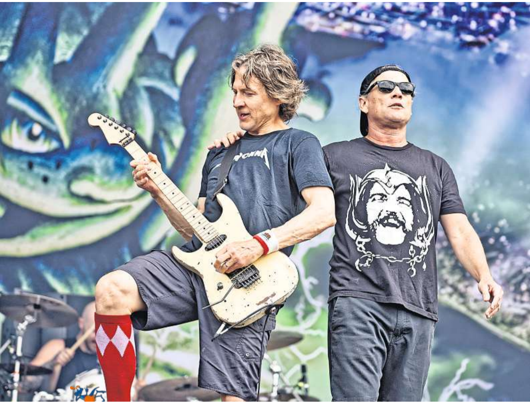
Auch „Ugly Kid Joe“ sind bei „Gewaltig Leise“ dabei.