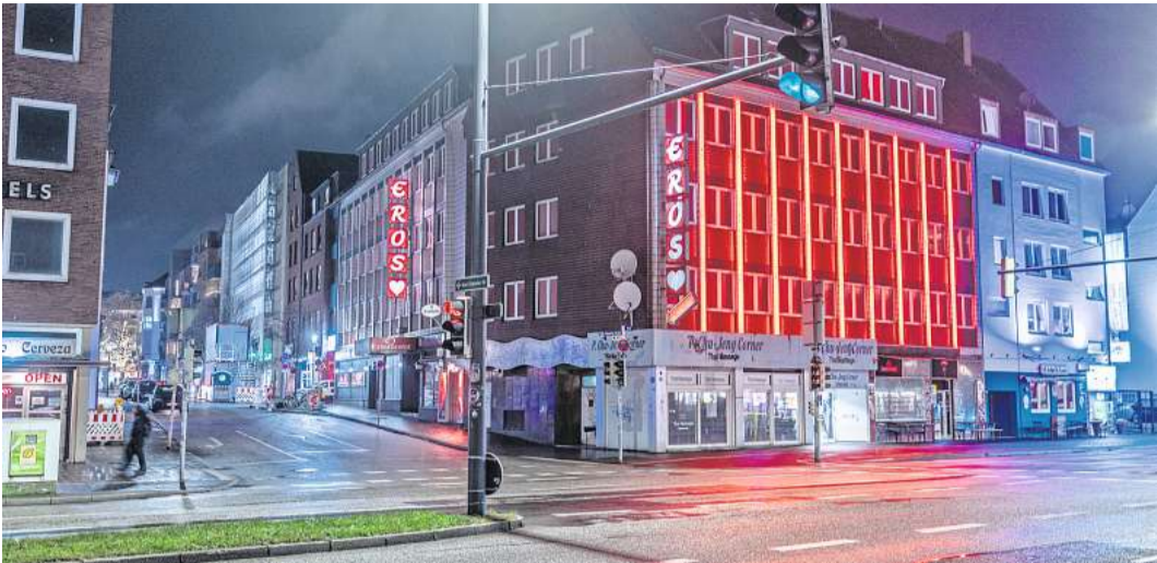
Auch im Bereich Flämische Straße und Wall soll in Kiel Anfang 2026 eine Waffenverbotszone eingerichtet werden.

Grundlage für die Einrichtung der neuen Waffenverbotszonen in Kiel sind die polizeiliche Kriminalstatistik und das Erfahrungswissen der Polizei. Besonders bei