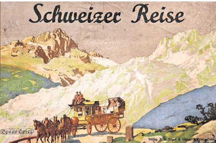
Auch historische Spiele wie die im Spear-Verlag erschienene „Schweizer Reise“ sind in der Ausstellung zu sehen.

Auch der geplante Spielennachmittag mit historischen Reise- und Spielen am Mittwoch, 21. Januar, wird das Thema „Schweiz“ haben. Direkt vor dem Spielennachmittag gibt es ab 14.15 Uhr eine kleine Führung durch die Ausstellung im Foyer. Um 15 Uhr beginnt im Anschluss der Spielennachmittag. Die Teilnahme an beiden Veranstaltungen ist ebenfalls kostenlos, aber wegen der begrenzten Platzzahl ist eine Anmeldung per E-Mail an info@lb-eutin.de oder unter Tel. 04521/788770 nötig.