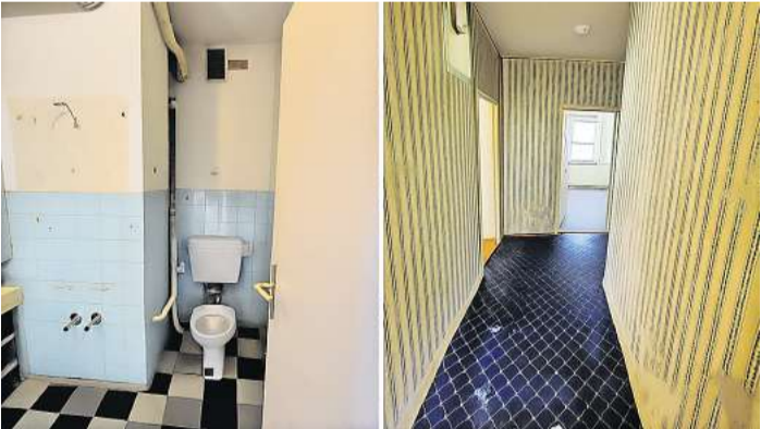
Die notwendige Sanierung einer Wohnung stellt viele Eigentümer oft vor finanzielle, zeitliche und nervenaufreibende Probleme. Für die beiden Kieler beginnt hier die Passion.

Nordlicht Projekt GmbH Holtener Straße 322, Kiel Tel. 0176/80127055 ahoi@nordlicht-projekt.de www.nordlicht-projekt.de