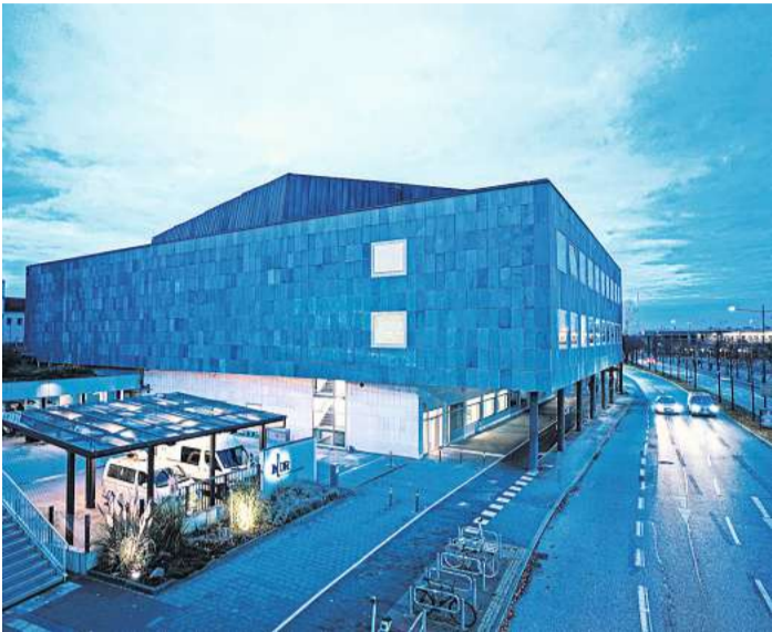
Mit dem 4. Philharmonischen Konzert und einem Tag der offenen Tür wird das „Konzerthaus am Schloss Kiel“ am Sonntag, 11. Januar, neu eröffnet.