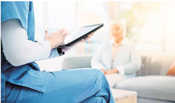
Kürzung des Pflegegeldes vermeiden: Regelmäßige Beratungsein-sätze sind für Bezieherinnen und Bezieher von Pflegegeld gesetzlich vorgeschrieben.