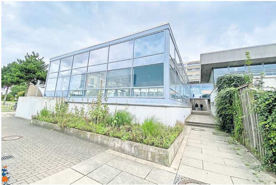
Das alte Lehrschwimmbecken an der Schwimmhalle Schilksee soll abgerissen und komplett neu gebaut werden.

Kieler Sport- und Gesundheitsdezernent Gerwin Stöcken drückte seine Freude über die Förderzusage so aus: „Ich bin wirklich dankbar für die kräftige Unterstützung von Bund und Land – damit schwimmt unser Projekt endlich auf Kurs. Als Stadt direkt am Wasser ist es für Kiel fast schon Pflichtprogramm, für