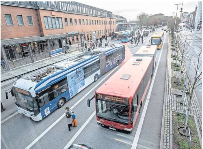
Die KVG erhöht zum neuen Jahr die Bustaktung bei zahlreichen Linien.

und natürlich Tankstellen. Die Stadtverwaltung Plön bietet alle Plönerinnen und Plöner um gegenseitige Rücksichtnahme, damit alle einen sicheren und angenehmen Jahreswechsel erleben können – ein Wunsch, der sich auf alle Orte im Verbreitungsgebiet des Kieler Express übertragen lässt. Auch das Team des Kieler Express wünscht allen ein schönes und gesundes Ankommen im neuen Jahr!