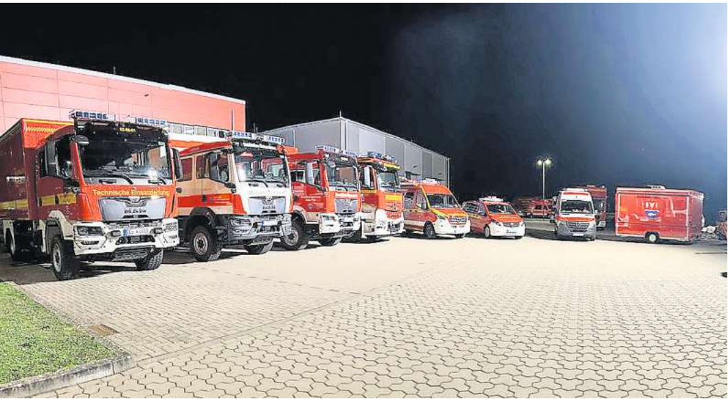
Insgesamt neun neue Einsatzfahrzeuge und Anhänger gab es für die verschiedenen Einheiten des Bevölkerungsschutzes im Kreis Plön.

einsetzen“, betonte Björn Demmin. Laut der Mitteilung des Kreises Plön sind die Herausforderungen für den Bevölkerungsschutz heute komplexer als jemals zuvor. „Extreme Wetterereignisse, technische Störungen und neue Gefahrenlagen verlangen von den Einsatzkräften ein Höchstmaß an Professionalität und Zuverlässigkeit. Moderne Einsatzfahrzeuge sind dabei weit mehr als reine Transportmittel – sie sind eine grundlegende Voraussetzung für wirksame Hilfeleistung“, heißt es in der Pressemitteilung. Insgesamt hat der Kreis Plön in den vergangenen beiden Jahren rund 2,8 Millionen Euro in die Beschaffung neuer Einsatzfahrzeuge für den Bevölkerungsschutz investiert. Für die kommenden Jahre ist die Auslieferung weiterer Fahrzeuge geplant. Dazu zählen zwei Krantransportwagen, ein Gerätewagen Sanität, ein weiteres Wechselladerfahrzeug mit Abrollbehälter Hygiene, ein zusätzlicher Einsatzleitwagen 1 sowie ein LKW mit Ladekran. Das hierfür vorgesehene Investitionsvolumen beträgt knapp 1,8 Millionen Euro.