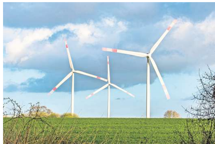
Auch die Effizienz von Windkraftanlagen hängt unter anderem von der integrierten Leistungselektronik ab.

Bei der Leistungselektronik geht es darum, elektrische Energie effizient umzuwandeln, zu steuern und zu speichern. Das ist entscheidend für den Stromverbrauch und die Effizienz von fast allen modernen Anwendungen, von Ladegeräten über Elektroautos und Windkraftanlagen bis zu Netzteilen und auch für die Erzeugung von „grünem Wasserstoff“. So spielen die damit verbundenen Technologien auch eine bedeutende Rolle für das Ziel, Schleswig-Holstein zum „ersten klimaneutralen Industrieland in der Bundesrepublik“ zu machen, wie es Energiewendeminister Tobias Goldschmidt formuliert.