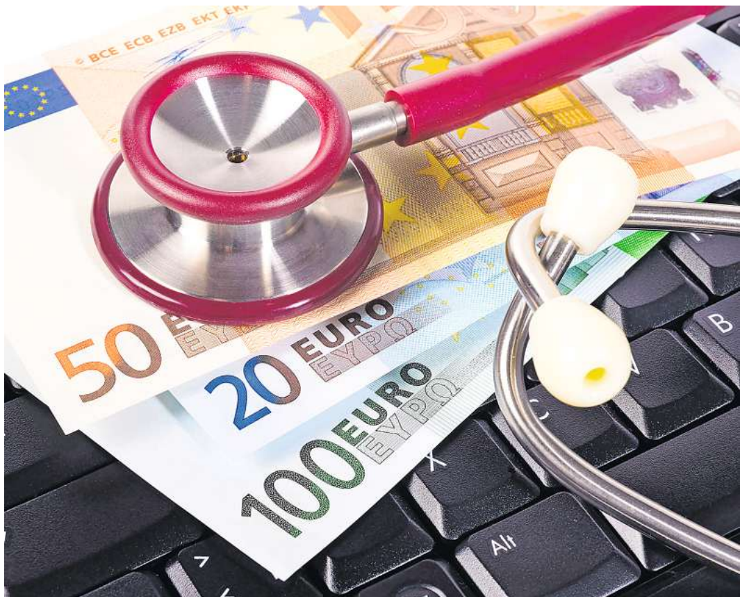
Mit rund 15,2 Milliarden Euro verabschiedete der AOK-Verwaltungsrat einen neuen Rekord-Haushalt für das nächste Jahr.