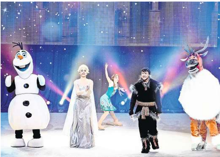
Die „Eiskönigin“-Stars sind am 2. Januar mit ihrer spektakulären Show in Kiel zu Gast.

kern, die ihr Publikum am 28. Mai 2026 ab 20 Uhr in der Stadthalle Eckernförde in die Klangwelt Lateinamerikas zu Beginn des 20. Jahrhunderts entführt. Tickets gibt es bereits jetzt im Internet unter www.ma-cc.com , bei Eventim, Reservix und allen anderen bekannten Vorverkaufsstellen.