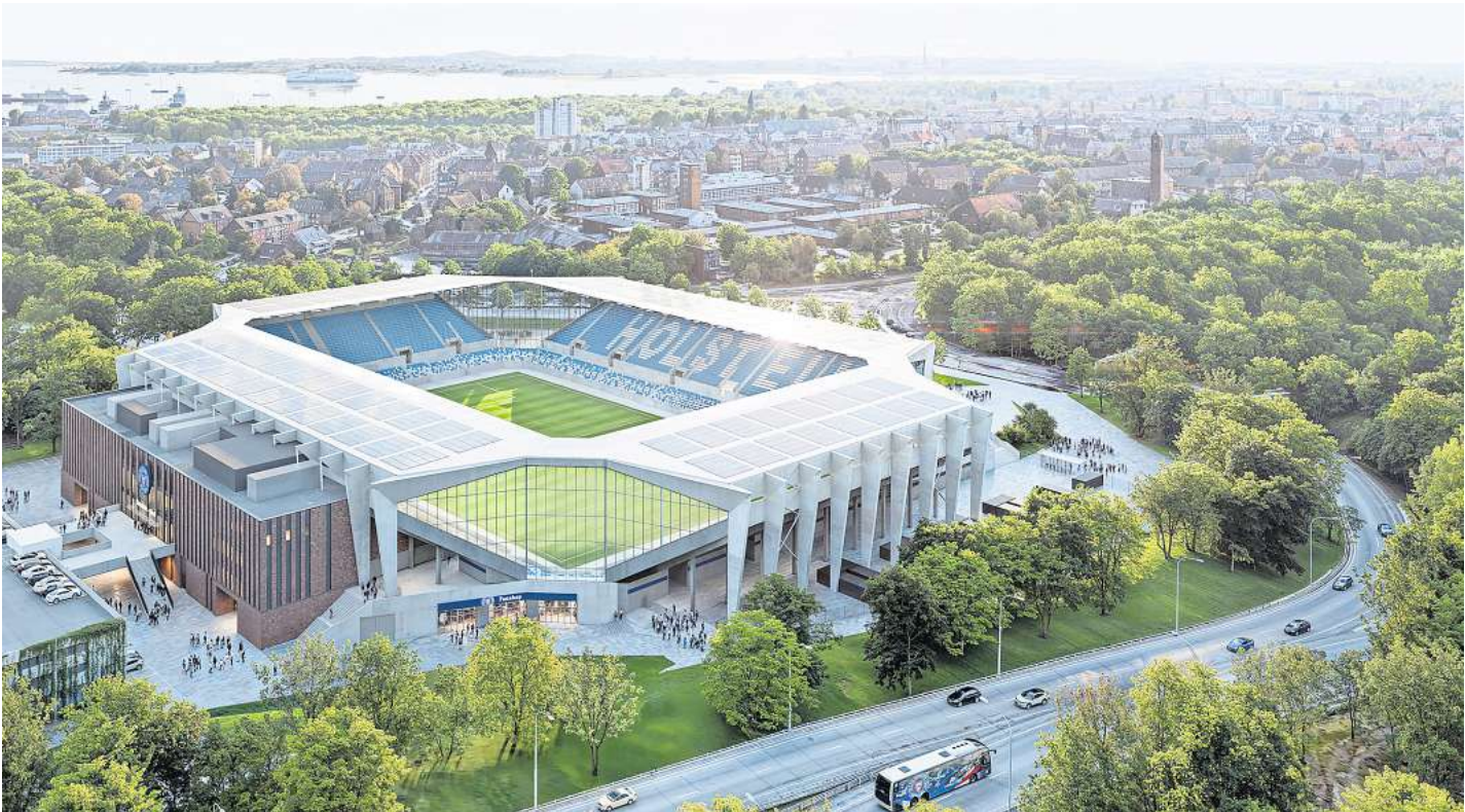
Diese Visualisierung zeigt den Entwurf des neuen Holstein-Stadions aus der Vogelperspektive.

Die geplante neue Arena wird 22 087 Zuschauerinnen und Zuschauern Platz bieten. Rund 44 Prozent entfallen auf Stehplätze, 56 Prozent auf Sitzplätze. Um die Barrierefreiheit weiter zu verbessern, soll das gesamte Gelände von der Projensdorfer Straße und vom Westring aus um drei Prozent in Richtung Spielfeld angehoben werden, um eine barrierefreie Zuwegung zu schaffen. Außerdem sollen insgesamt 64 Rollstuhlplätze und 60 Plätze für sehbehinderte Fans entstehen.