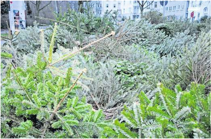
Bevor die alten Weihnachtsbäume auf den Sammelplatz kommen, müssen sie sorgfältig abgeschmückt werden.

KIEL. Während sie an Heiligabend das Zentrum der Feierlichkeiten sind, schwindet das Interesse an den bunt geschmückten Tannenbäumen danach rapide. Spätestens am Dreikönigstag, 6. Januar, haben die meisten ausgedient. Auch 2026 bietet der Abfallwirtschaftsbetrieb Kiel (ABK) in Kiel eine kostenlose Tannenbaumabfuhr an. An insgesamt 220 Sammelstellen im ganzen Stadtgebiet können die ausgedienten Christbäume nach Weihnachten, bis Montag, 16. Februar, abgelegt werden. Eine Übersicht der Sammelplätze ist online unter www.abki.de zu finden.