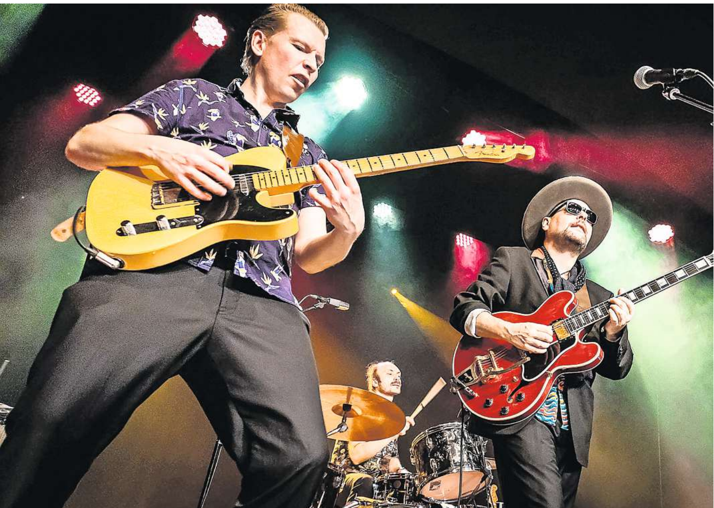
The Blues Overdrive aus Dänemark sind zu Gast beim Kieler Blues Festival 2026. Die Musiker standen schon mit legendären Künstlern wie Paul McCartney gemeinsam auf der Bühne.

Vom 29. bis 31. Mai 2026 werden die Baltic Sea Darts Open in der Wunderino Arena in Kiel erneut zum Schauplatz intensiver Duelle. Im vergangenen Jahr krönte sich Gerwyn Price eindrucksvoll zum Champion und ließ die Menge jubeln. Die besten Spieler der Welt kämpfen nicht nur um Preisgeld und den Titel, sondern auch um die Qualifikation für die prestigeträchtige European Darts